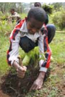
小学校の環境クラブも植林に協力します。

3.11の大震災により、相馬本部事務所との連絡が途絶え、現地の活動資金も底をつくなど、想定外の状況に陥りました。エチオピア側でも大変な動揺が走ったものの、事務所とスタッフの無事が確認できた後は、幸いにも目標達成に向けての一体感が高まりました。