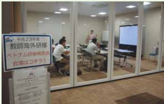
外からもご覧いただけるように、ガラス張りの会場で実施された報告会

報告会の合間には、世界につながる一歩として用意した、地域で見つかる世界のお茶やお菓子とともに報告会に参加された方々と意見交換を行うなど、有意義な時間を過ごすことができました。