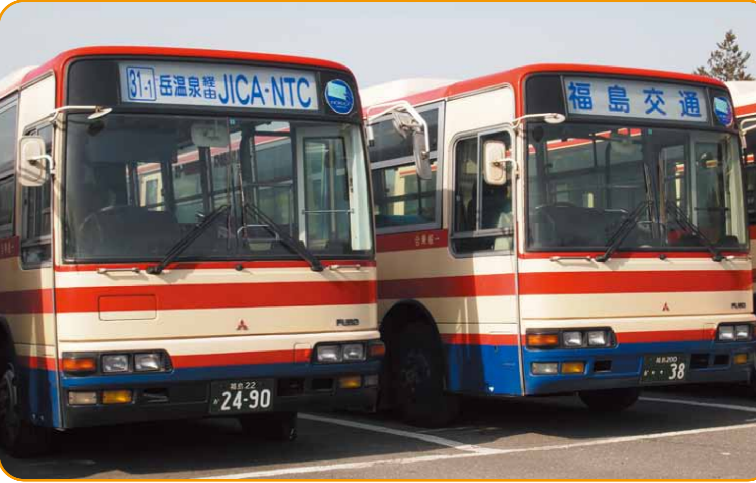
二本松と世界を結ぶ路線バス