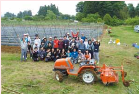
地域のボランティアの方々を整備した農園にて

※農園は、地域の空き農地を利用し、被災者の健康増進や雇用促進を目的として運営されています。